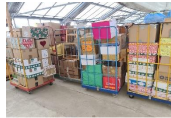
Das Lager voller Weihnachtspakete

Zusätzlich wurden noch vor Ort in Kroatien 1.000 Euro für die Aktion „Brot und Milch“ für die Kinder in Vukovar und 1.000 Euro für die Aktion „Holz und Kohle“ in Vinkovci übergeben. Eine an Leukämie erkrankte Jugendliche konnte mit 500 Euro für teure Medikamente unterstützt werden. Pfarrer Korov aus Kosca bekam 1.000 Euro für besondere Notfälle. Ein schwer erkrankter Mann konnte mit 500 Euro für teure Medikamente unterstützt werden. Das Seniorenheim in Domanovci erhielt zusätzlich zu den Weihnachtspaketen und Inkontinenzprodukten 1.000 Euro für Lebensmittel und Medikamente. Der „Fond für kinderreiche Familien“ zusätzlich zu den Weihnachtspaketen 1.000 Euro für bedürftige Familien.