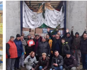
Ankunft und Entladung in Vinkovci und Vukovar