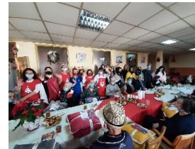
Einige Senioren und Mitarbeiterinnen des Seniorenheims Domanovci