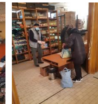
Vinkovci: Ausgabe der Lebensmittel